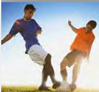
Fußball / Soccer