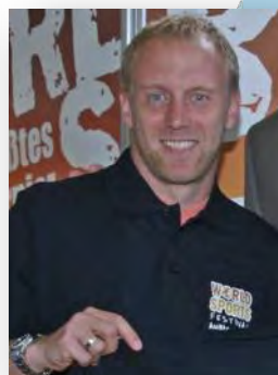
Stefan Koubek - Tennis, TOP 20 der Weltrangliste 2000