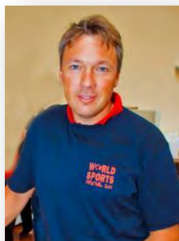
Fritz Strobl - Skifahren, Olympiasieger Abfahrt 2002

Zahlreiche österreichische und internationale Sportgrößen unterstützen als Botschafter das World Sports Festival 2011. Sie sind von der Idee des Events überzeugt und geben den jungen Athletinnen und Athleten als Vorbilder wichtige Informationen mit auf ihre sportlichen Wege.