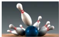
Bowling girls and boys U14 - U18