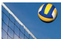
Volleyball girls and boys U15 - U17