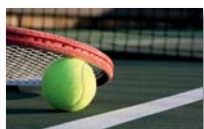
Tennis girls and boys U13 - U16 - U18 - U21