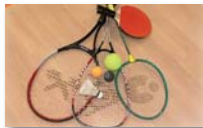
Racketlon girls and boys U13 - U16 - U18 - U21