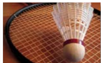
Badminton girls and boys U13 - U16 - U18 - U21