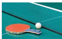
Tabletennis girls and boys U13 - U16 - U18 - U21