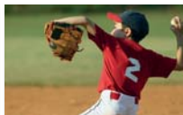
Baseball boys U13 - U15