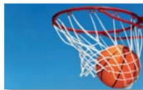
Basketball girls and boys U14 - U16 - U18