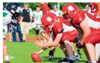
American Football boys U12 - U14 - U16 - U19